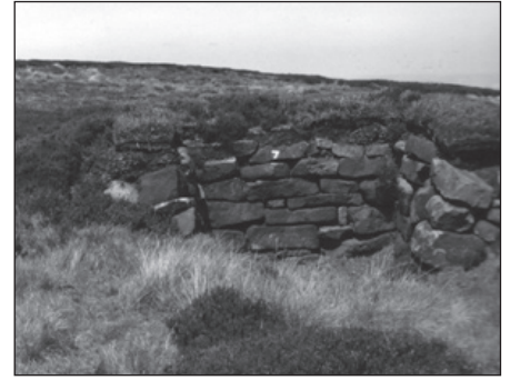
Grouse butts' - schuilplaats voor jagers

Voordat dit traject ten einde loopt komt er nog een kans op een overweldigend panorama. Het ligt nabij een kruising van paden waar de route naar links afbuigt. In de diepte ligt het ingeklemde Oak Dale waterreservoir met op de achtergrond wat rode daken van boerderijen of huizen in de buurt van Osmotherley. Hier begint ook de begroeiing geleidelijk te veranderen: de kalksteen houdende bodem wordt leisteenachtig. Er komt iets van grasland in zicht met hier en daar wat vee. Het langzaam dalende pad verlaat daar het heidegebied. Via bruggetjes over een tweetal beken komt het pad op een omvangrijke akker van White House Farm uit. De mar-