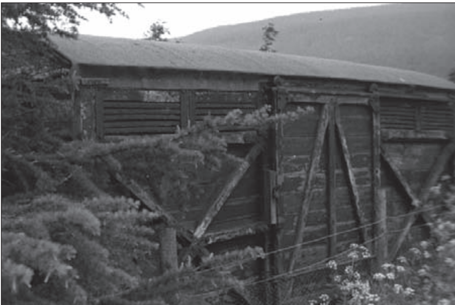
Een wagon als schuilplaats. Hoe zou dat ding daar gekomen zijn?

1 Ordnance Survey Touring Map 2 'North York Moors' Showing the National Park