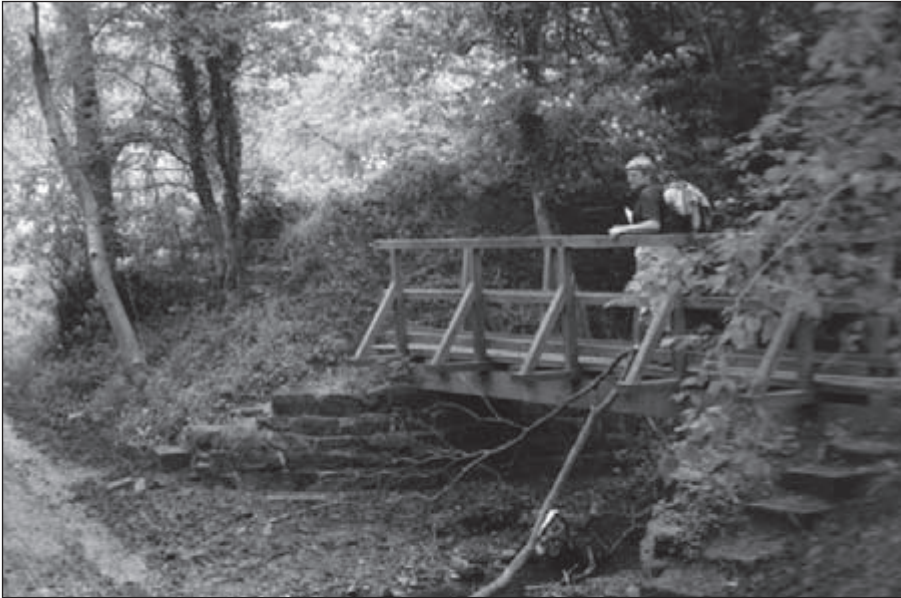
Brug over de tijdelijk uitgedroogde Piper Beck

nauwkeurig aangeeft, is er rondom een nauwelijks te bevatten uitzicht. In de verste verte valt er geen huis of boerderij te bekennen. Rechts en voor ons uit de onafzienbare glooiende heide, links vlijmscherpe, veelkleurige hellingen met op de achtergrond de drukke A19.