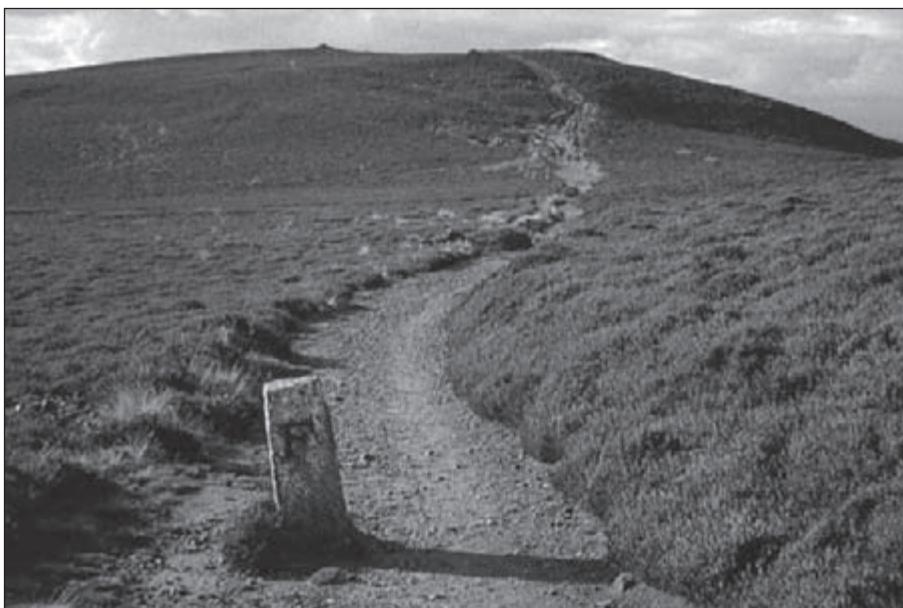
Eeuwenoude grensstenen met gravure markeren het oorspronkelijke veedrijverspad